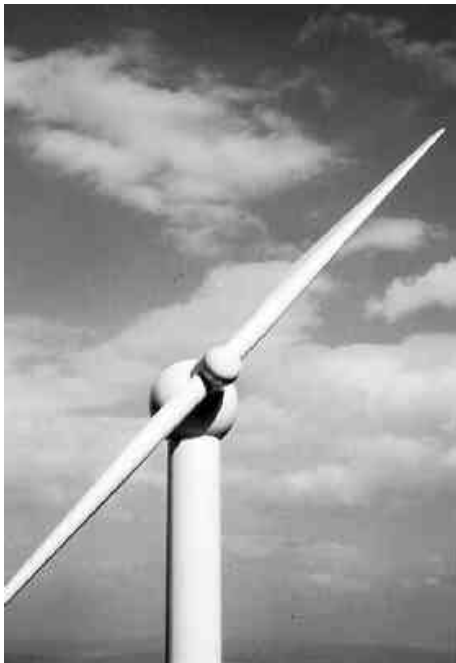
Auszug aus "WINDPRODUKT", Projektarbeit M.Velte, GH Kassel

Die Thematik wurde im Verlauf der Veranstaltung durch Kurzvorträge und Fallbeispiele beleuchtet und unter den 24 Teilnehmern aus den Bereichen INDUSTRIEDSIGN, HERSTELLUNG/KONSTRUKTION, FORSCHUNG und EVU/VERBÄNDE/POLITIK engagiert diskutiert.