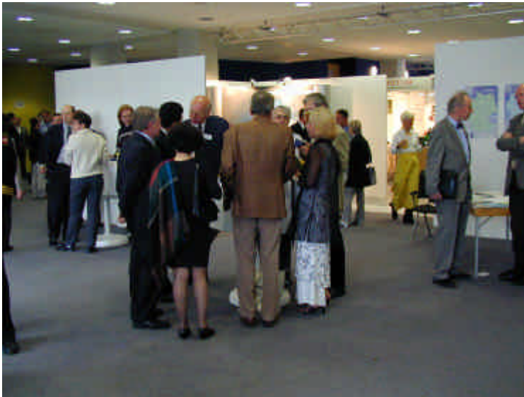
Abb. 2: Die Gäste der 10-Jahresfeier beim Gespräch innerhalb der Firmenstände der DEWEK 2000 im Foyer der Stadthalle