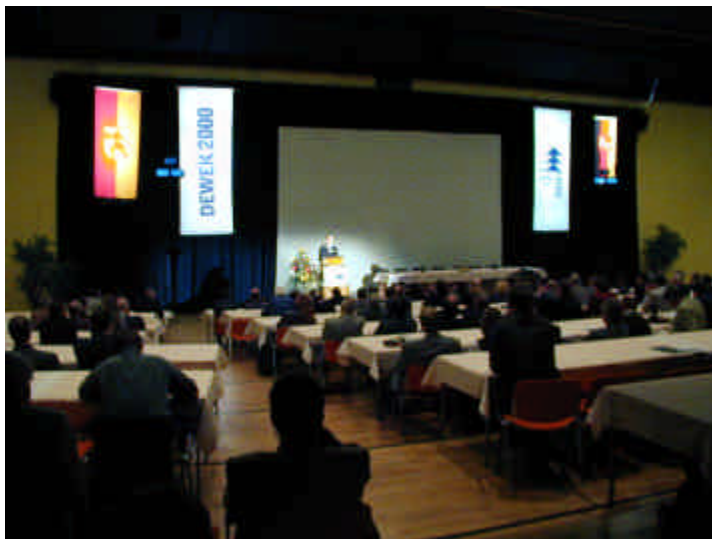
Abb. 1: 10-Jahresfeier im für die DEWEK 2000 vorbereiteten Konferenzsaal der Stadthalle Wilhelmshaven

schloss die Staatssekretärin ihre Ausführungen.