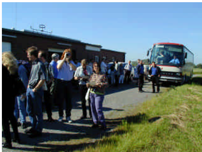
Ankunft des "Besucherstroms" auf dem Testfeld des DEWI

It was a surprise and of course a sign of recognition as well that companies sent numerous employees, whereby one manufacturer set the record with over 20 participants. With over 60 lectures and 40 posters, which were all very interesting and above all dealt with current topics, there was clearly an incentive to participate. The DEWEK was also certainly a welcome opportunity to train the many new employees in the booming wind energy industry and to bring them into personal contact with other companies and customers. The subjects of offshore and complex terrain were in the foreground as priorities, but many another lecture showed that news was not only to be reckoned with there. The lecture on wind measurement results influenced by the anemometer type caused a big sensation, particularly as the effect on the reference energy yield defined in the new German "Renewable Energies Act" cannot be neglected (see article page 5).