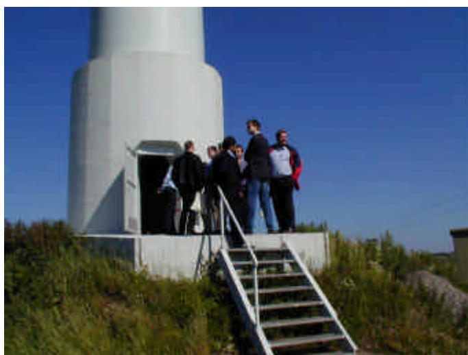
Besichtigung der Tacke TW 1.5s

An excursion to the DEWI testing area, the largest in the world with 10 MW installed power, was offered for the day after the conference. The manufacturers Nordex Borsig Energy, Tacke Windenergie (Enron Wind), AN Windenergie and Vestas gave the 68 participants a comprehensive demonstration of their megawatt systems operated there in sunshine and strong wind. The contactfree 3D motion measurement from Delft University (DEWI Magazine no. 16, February 2000, p. 60 ff), installed in the tower of the Tacke 1.5s, was also able to be impressively demonstrated in operation.