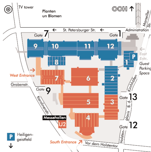
Abb. 2: Lage der für die WindEnergy vorgesehenen Hallen 3 - 7