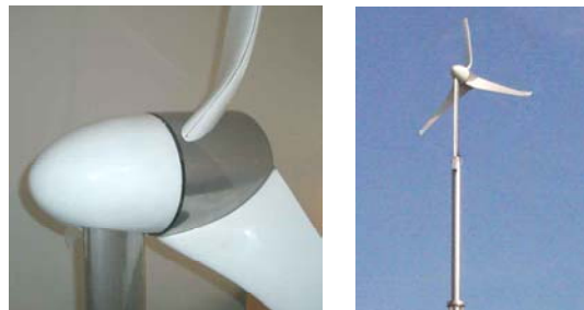
Abb. 3: Windkraftanlage H180, Leeläufer mit automatischer Windnachführung, 1,0 kW Nennleistung, Durchmesser 1,80 m mit aerodynamisch optimierten Rotorblättern (Patent angemeldet)