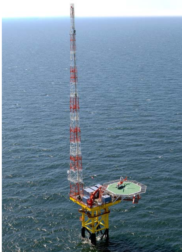
Abb. 3: Das Photo zeigt die Forschungsplattform FINO 1 in der Nordsee mit 100 m hohem Windmessmast und Hubschrauberlandeplatz. Hier werden Daten für die Planung künftiger Offshore-Windparks erhoben.

Most of the current offshore expansion projects would never have existed without the North Sea research platform FINO 1. This striking structure,