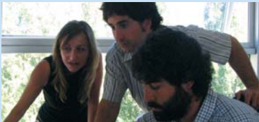
The Subsidiary of DEWI in Spain page 79