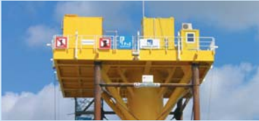
Researching Climate Protection page 6