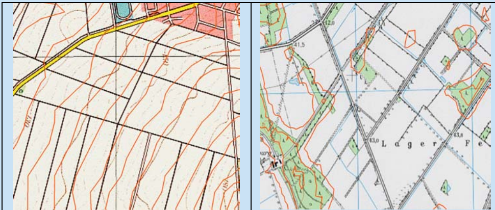
Fig. 1 and 2: Examples for extracted SRTM contour lines Abb. 1 und 2: Fallbeispiele für extrahierte SRTM Höhenlinien