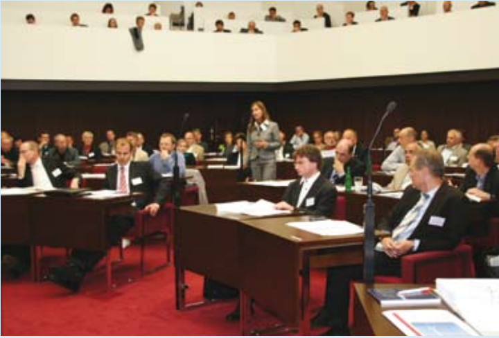
Fig. 1: Discussion in the plenary hall of the Bremen state parliament