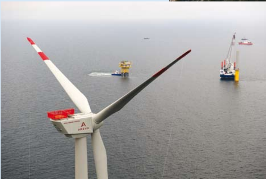
Fig. 4-6: Erection of the first wind turbine in the alpha ventus offshore test site