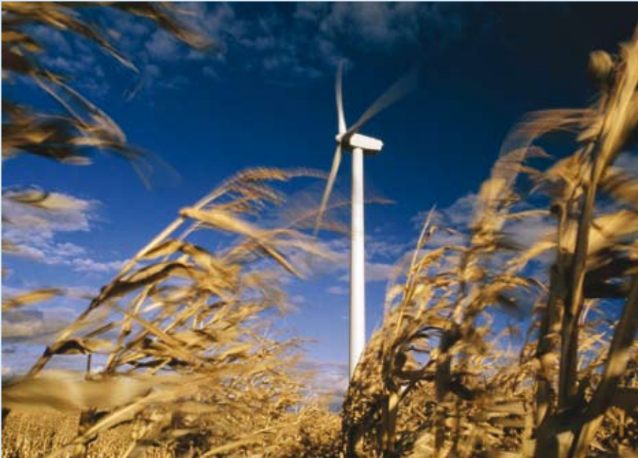
Fig 3: Wind farm in Castilla La Mancha Fig 3: Parque eólico en Castilla La Mancha