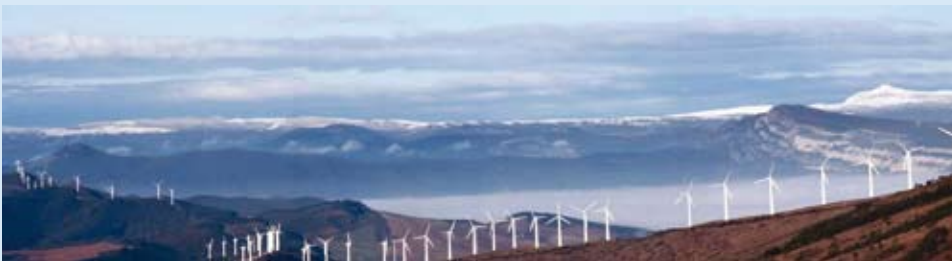
Fig. 4: Parque eólico de "El Perdón" (Navarra). Las instalaciones de DEWI-Spain se encuentran a 10 km de este parque. Fig. 4: "El Perdón" wind farm (Navarra). DEWI-Spain office is placed 10 km from this wind farm.

more than 73,900 employees in Spain, reinforcing our position in Europe, where Spain is in the first position in solar thermal energy, second in wind and solar photovoltaic energy and third in mini-hydraulic energy.