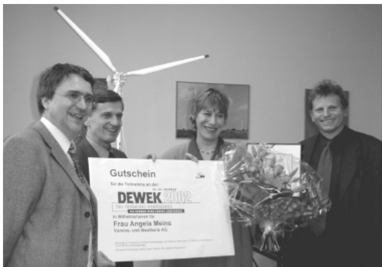
Abb. 1: Begrüßung der 1000. Kursteilnehmerin.

Neben den ein- und zweitägigen Seminaren, die das DEWI in seinen Programmen anbietet, haben auch die sogenannten "In-house Seminare" stark zugenommen, wie Abb. 2 zu entnehmen ist. Dieses gesteigerte Interesse der Industrie an diesen Kursen im eigenen Betrieb hat sicherlich zwei Gründe: Einerseits erfordert das starke Wachstum