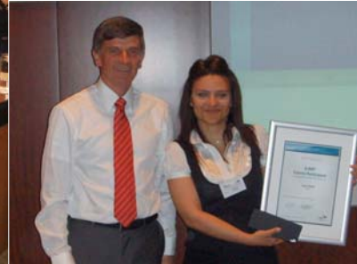
Abb. 1: 65 Teilnehmer besuchten Ende Mai 2008 das DEWI-Seminar in Ankara/Türkei Rechtes Bild: Übergabe des Geschenks an die 3000. Teilnehmerin