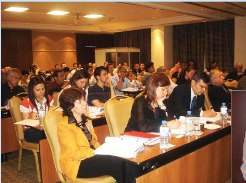
Fig. 1: 65 participants attended the DEWI seminar in Ankara/Turkey at the end of May 2008. On the right: Handing over a present to the 3000th participant