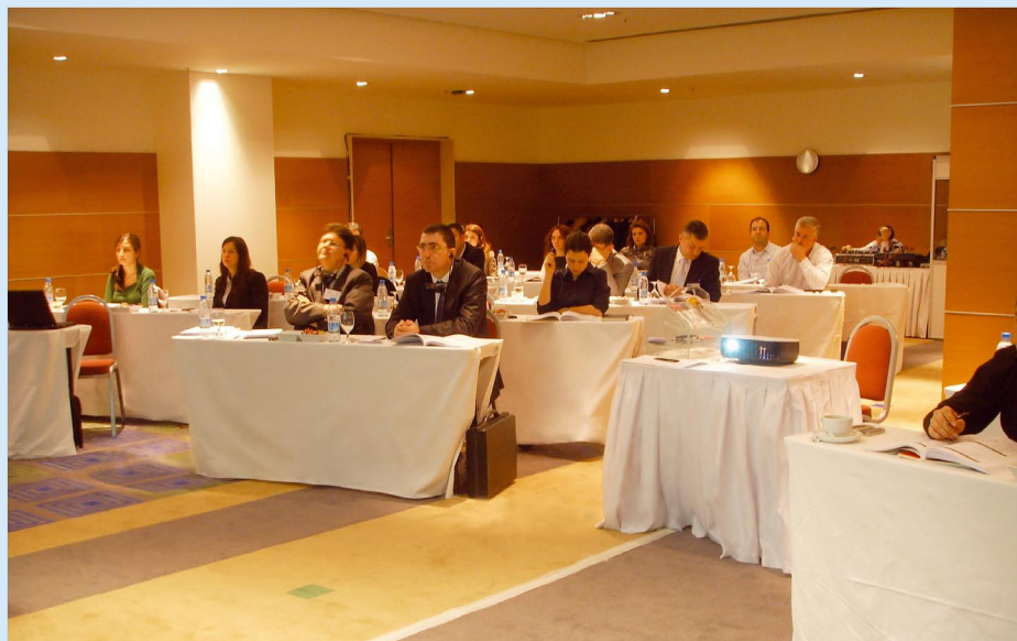
Fig. 2: DEWI seminar in Turkey